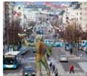
KÄND ADRESS. ESS Hotell tar sig in på Avenyn.